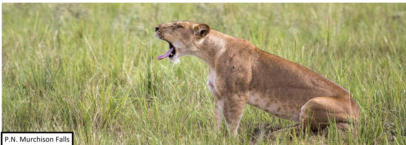
P.N. Murchison Falls

NOTA IMPORTANTE: debido al número máximo de permisos de los gorilas proporcionados diariamente por el P.N. Bosque Impenetrable de Bwindi, os rogamos que hagáis la reserva con la mayor antelación posible para poder confirmaros disponibilidad.