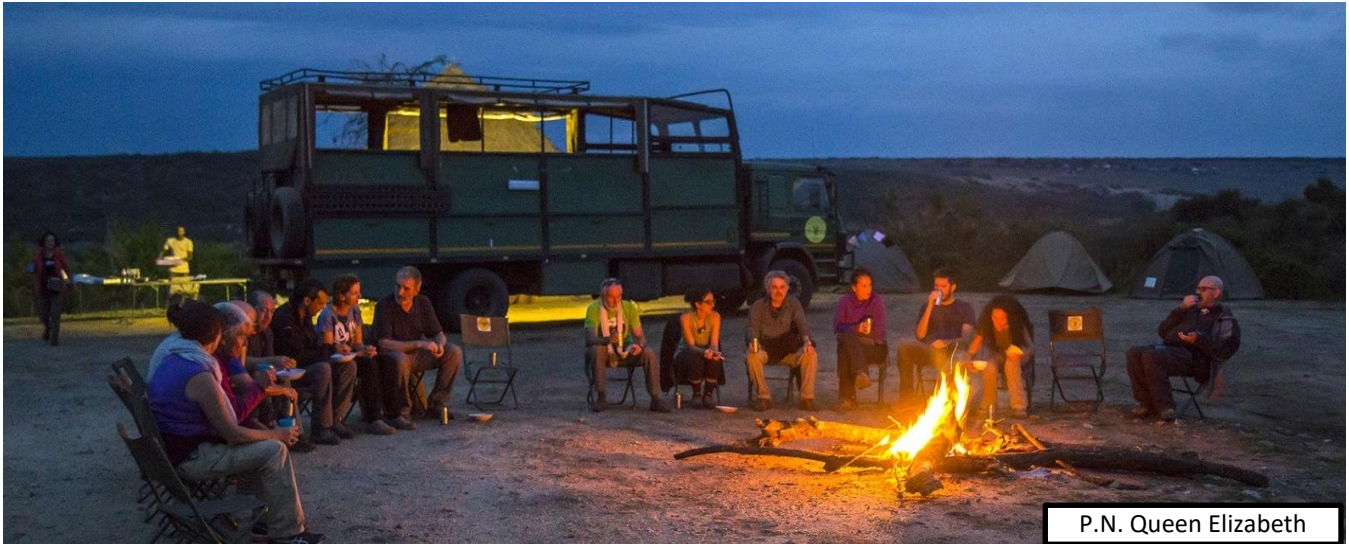
P.N. Queen Elizabeth