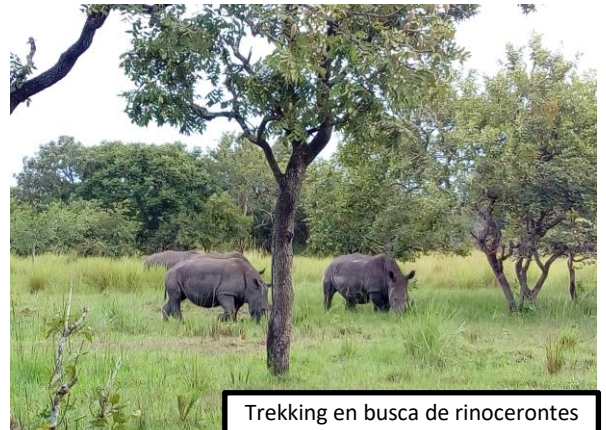
Trekking en busca de rinocerontes

Además de rinocerontes, este santuario se caracteriza por albergar en sus llanuras animales como oribis (pequeños antílopes), cobos de agua y un sinfín de aves.