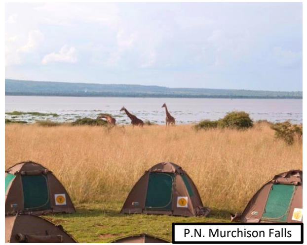
P.N. Murchison Falls