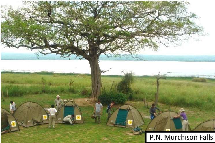
P.N. Murchison Falls

Dormimos 5 noches en los parajes más bellos, espectaculares y exclusivos de los Parques Nacionales más reconocidos de Uganda. Las puestas de sol de África, en medio de impresionantes y silenciosos escenarios naturales y la posterior cena y charla alrededor del fuego, crearán sin duda, momentos mágicos e inolvidables.