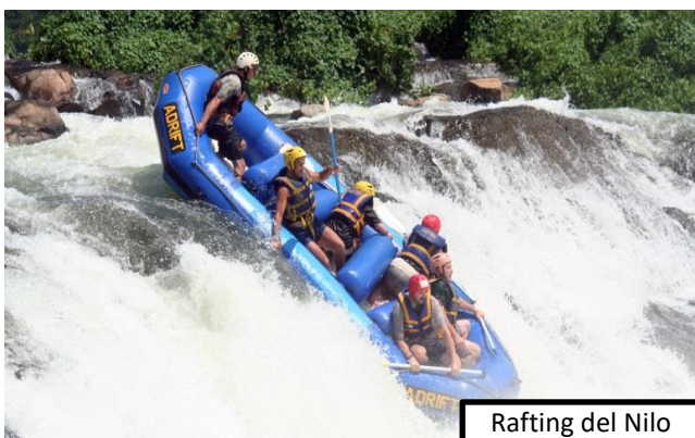
Rafting del Nilo

En 1857 Richard Burton y John H. Speke se embarcaron en una de las expediciones más ambiciosas y románticas de la historia: la búsqueda del nacimiento del Nilo. No fue hasta 1862 que Speke llegó a ver las fuentes describiéndolas como "el espectáculo más bello que vieran sus ojos". Durante nuestra ruta, el Nilo nos acompañará en su paso por el Parque Nacional Murchison Falls y seguiremos su curso hasta el Lago Victoria, en Jinja. En los alrededores de este poderoso gigante podremos hacer algunas actividades, desde ir en quad o en mountain bike, hasta montar a caballo, o simplemente descansar contemplando las preciosas vistas que nos rodean.