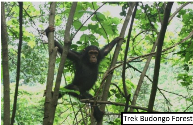
Trek Budongo Forest

Los trekkings en nuestras rutas están planeados para adentrarnos en la naturaleza e historia del país. No es necesaria una preparación física específica para realizar estos trekkings, pero sí que se requiere tener unas condiciones físicas mínimas .