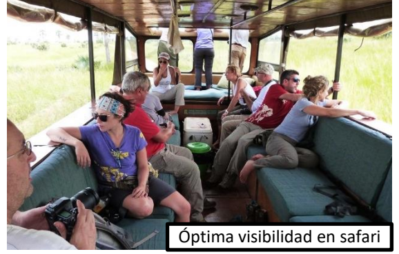
Óptima visibilidad en safari

Nuestra flota de vehículos está compuesta por 23 camiones , adaptados en nuestro taller de Arusha, Tanzania, para realizar todo tipo de safaris. Es el medio de transporte más versátil y práctico para disfrutar del viaje, dado su campo de visión de 360° para localizar y fotografiar animales. Además, crea buena convivencia entre los viajeros. Están equipados con material de acampada, cocina, cargadores para dispositivos electrónicos y almacenaje individual para cada viajero.