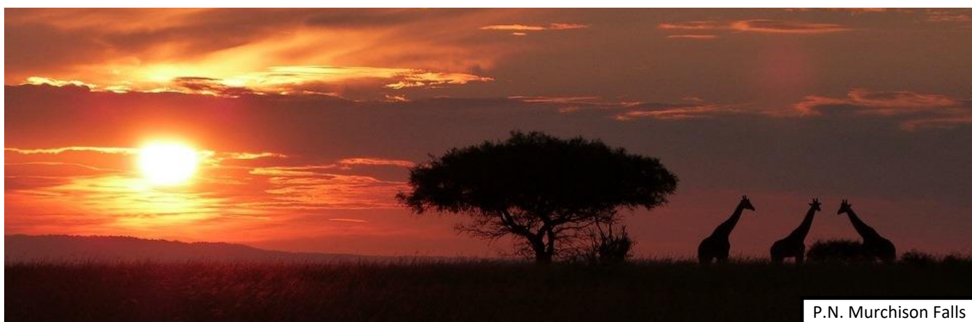
P.N. Murchison Falls