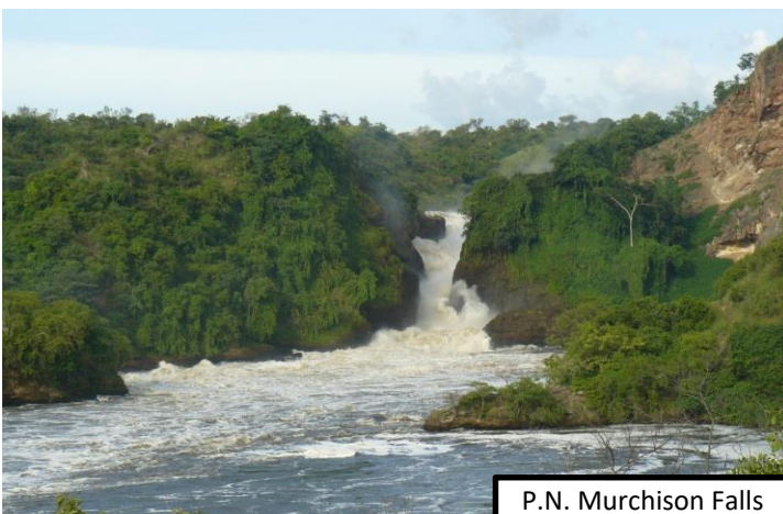
P.N. Murchison Falls

Con una extensión de 3.840 km 2 se trata del parque nacional más extenso de Uganda. Famoso por sus exuberantes llanuras salpicadas de palmeras, acacias, bosques y manadas de animales, uno de los mayores atractivos son los 115 km del río Nilo que lo recorre de este a oeste antes de desembocar en el Lago Alberto. Rodeados de búfalos, hipopótamos, aves multicolores y, como no, los voraces cocodrilos, recorreremos en barca el Nilo Victoria con la vista de las Cataratas Murchison como telón de fondo. Las aguas del río rompen en tres cataratas con 43m de caída en tan solo 6m de ancho: siendo la más poderosa fuerza hidráulica natural de la Tierra, idónea hasta las rocas tiemblan por la fuerza de la caída del agua! Desde la parte superior de las cataratas, denominada Top of the falls, divisaremos la hermosura del río más largo de África.